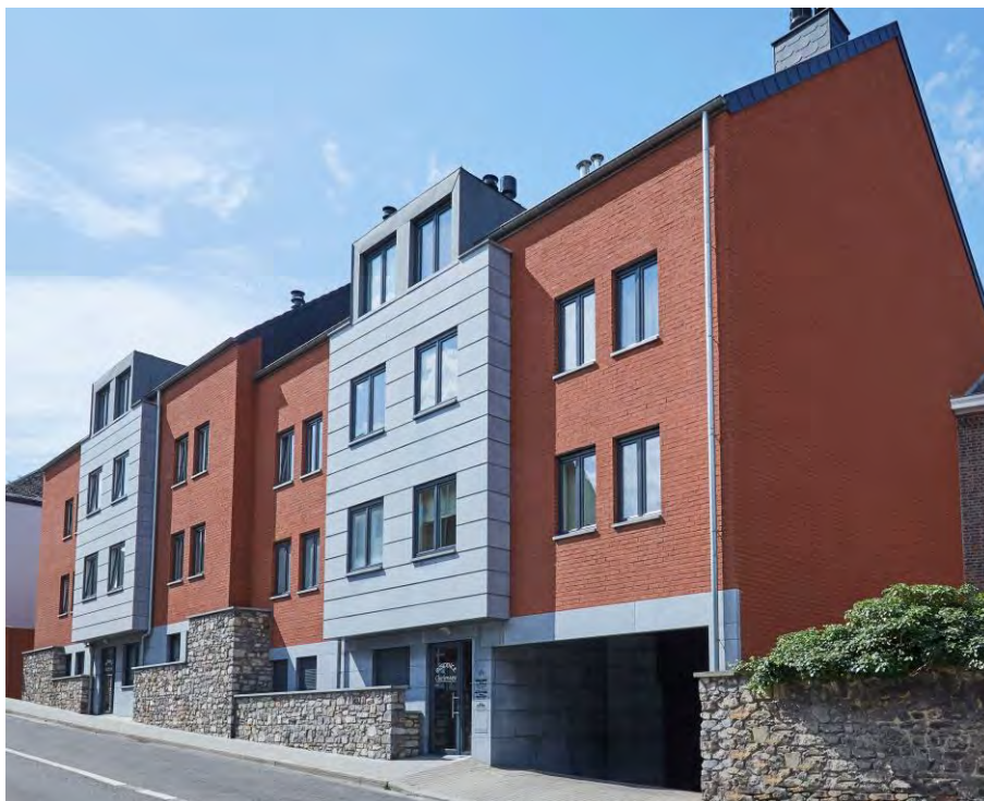
HUY - BELGIQUE - 2012