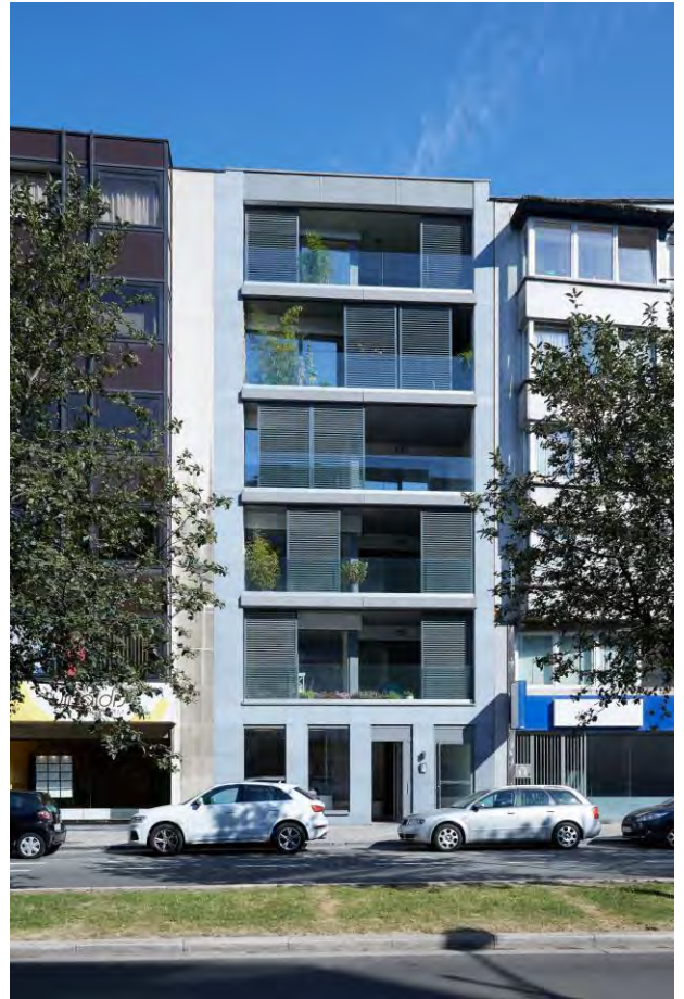
LIEGE - BELGIQUE - 2016

Un local poubelles est prévu au niveau -1.