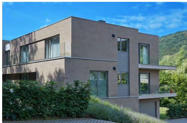
EMBOURG - BELGIQUE - 2014