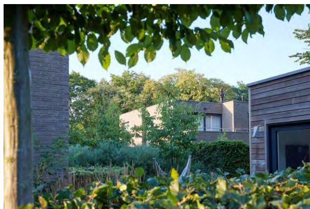
EMBOURG - BELGIQUE - 2013

Chaque appartement est équipé d'un compteur individuel de la compagnie de distribution, installé dans une pièce des compteurs commune au sous-sol.