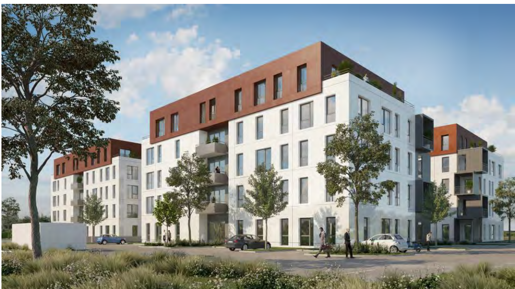
LYON - FRANCE - 2020