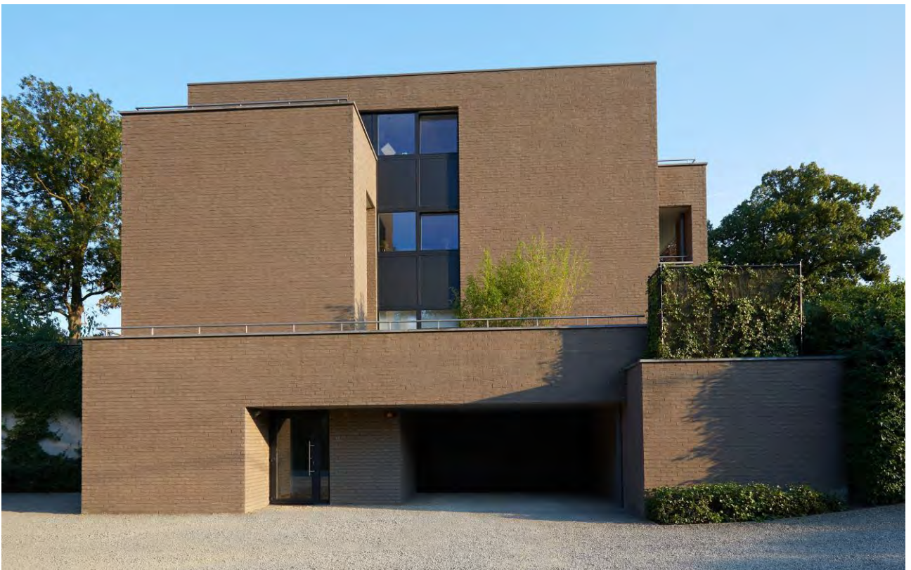
EMBOURG - BELGIQUE - 2013

L'entrepreneur prévoit le câblage pour la télédistribution, internet et le téléphone. Celui-ci est préparé, en attente, jusqu'à l'intérieur de l'appartement. L'acquéreur doit lui-même assurer l'installation et le raccordement. Toutes les demandes d'abonnement relatives à la télédistribution, à internet et au téléphone seront introduites par l'acquéreur.