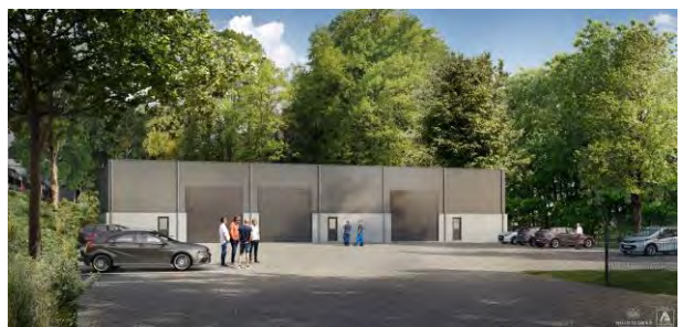
CHAUDFONTAINE - BELGIQUE - 2020

Il n'est pas permis à l'acquéreur d'effectuer lui-même, ou via des tiers, des travaux sur le chantier avant la réception provisoire. Si l'acquéreur effectue lui-même ou via des tiers des travaux au bien à l'insu du maître d'ouvrage, ceci vaut pour acceptation de la réception provisoire de ses parties privatives. Dans ce cas, l'entrepreneur et le maître d'ouvrage sont déchargés de toute responsabilité et garantie à l'égard de l'acquéreur en ce qui concerne les travaux du bien concerné. Toute forme d'entrée en jouissance vaut également pour acceptation de la réception provisoire.