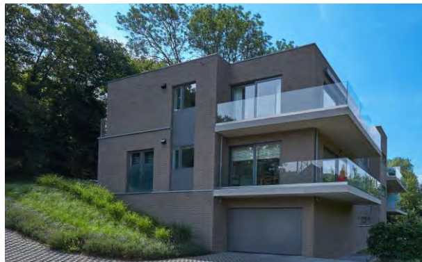
EMBOURG - BELGIQUE - 2014

Sauf demande expresse écrite de la part du syndic (en ce qui concerne les parties communes) ou de l'acquéreur (en ce qui concerne les parties privatives), la réception définitive est acquise automatiquement un an après la réception provisoire et marque la fin de période de garantie suivant les dispositions légales en la matière. Cette réception définitive a pour objectif de vérifier si aucun vice caché n'a été découvert pendant cette période d'un an et si toutes les observations de la réception provisoire ont effectivement été levées.