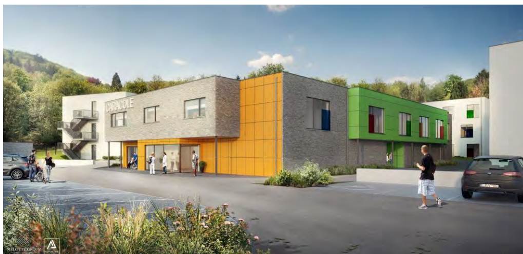
NAMUR - BELGIQUE - 2020