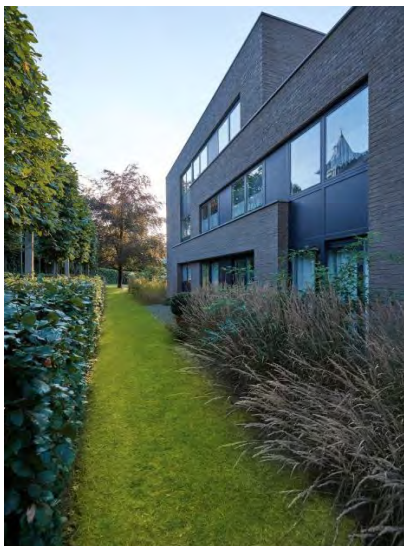
EMBOURG - BELGIQUE - 2013

Les portes d'entrée des immeubles à appartements sont fabriqués avec des profils en aluminium.