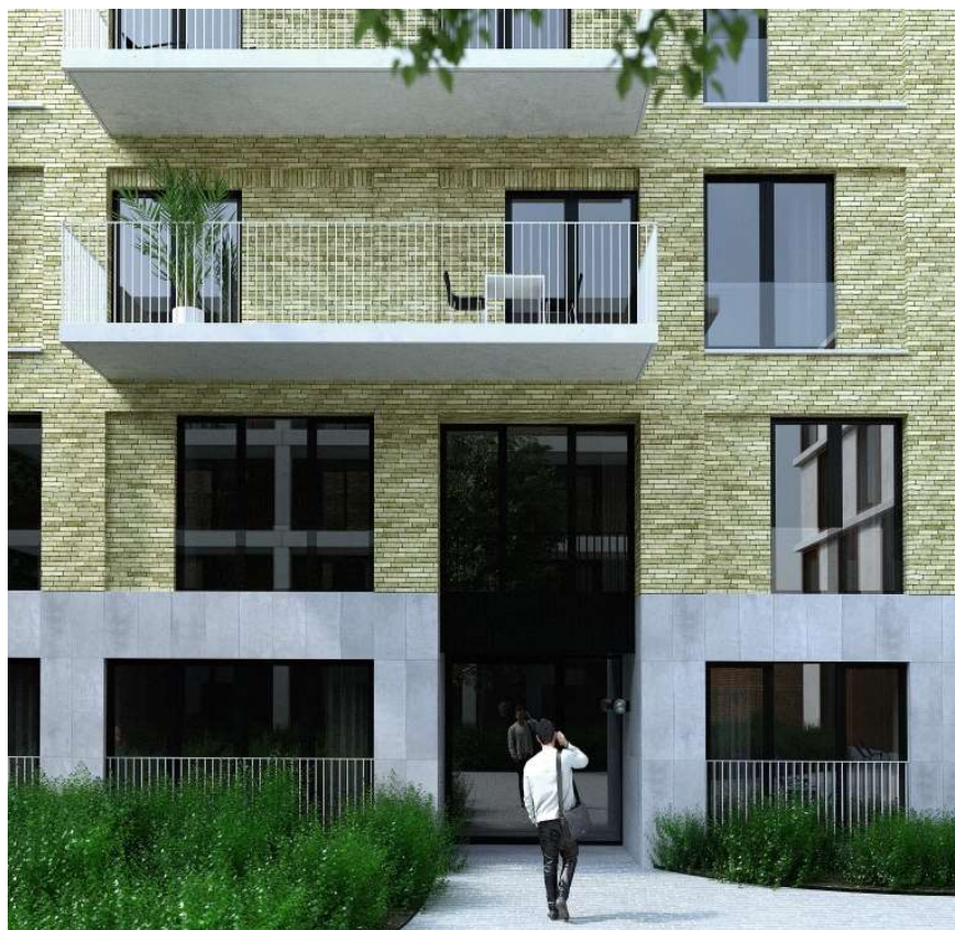
visualisatie (niet bindende weergave)

De betonnen terrassen en betonnen gevelelementen (raamdorpels) worden uitgevoerd in grijs beton. De inpandige terrassen worden afgewerkt met een witte gevelbepoetsing .