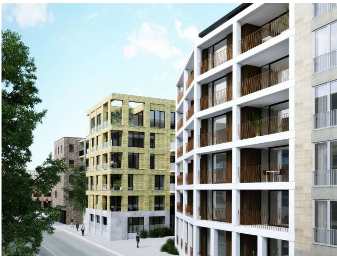
visualisatie (niet bindende weergave)

De zijgevels van gebouw D en gemene muren van de gebouwen C/D worden afgewerkt met een witte gevelbepleistering.