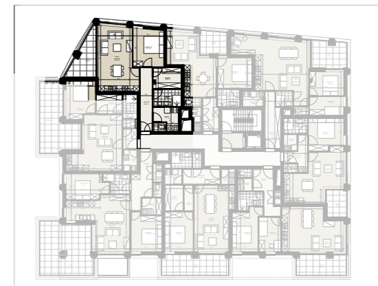
Niveau 2 1/500