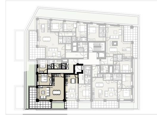
Niveau 3 1/500