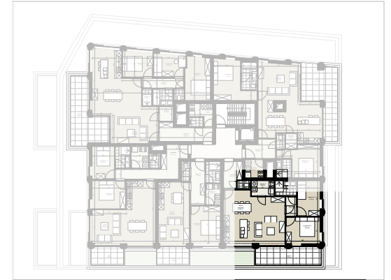
Niveau 4 1/500