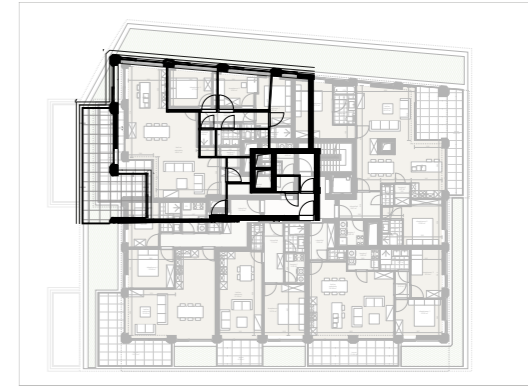
Niveau 3 1/500