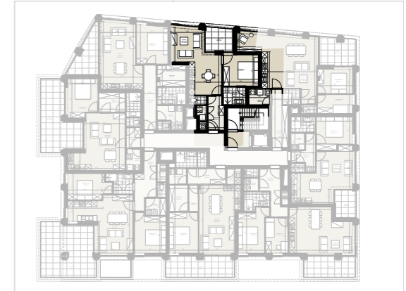
Niveau 2 1/500