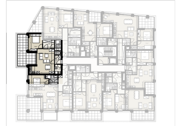
Niveau 2 1/500