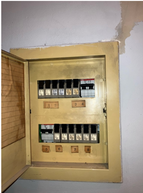
( Elektrisch bord )