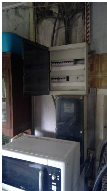
kelder gezien zolder gezien