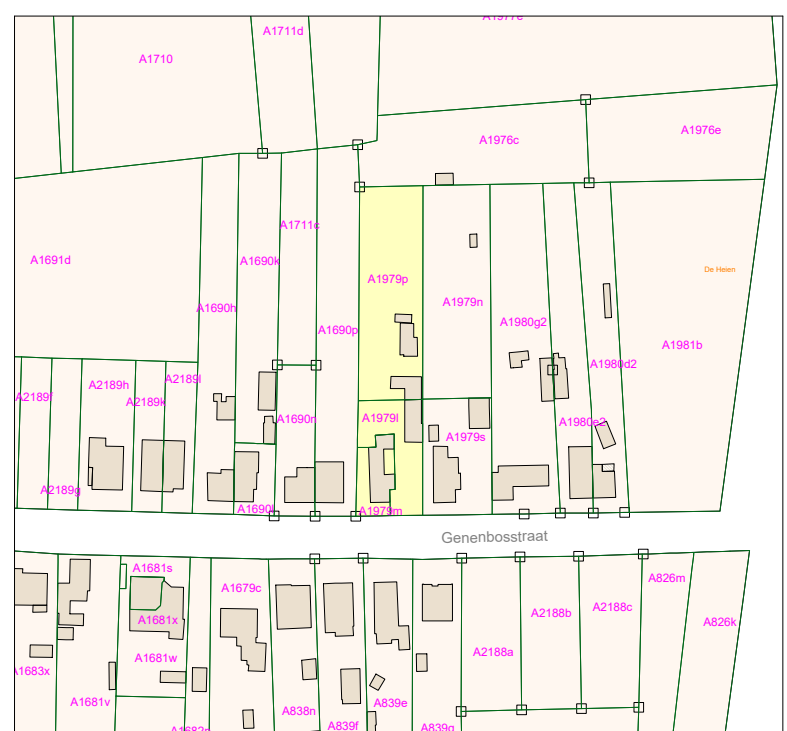
Kadasterplan Schaal : 1/2500