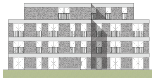
Voorgevel Blok B