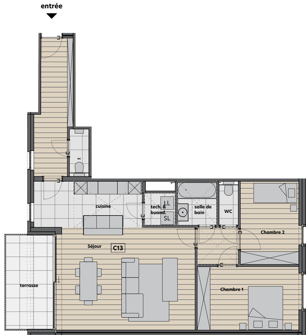
Plan R+1 1/100

Séjour : 41.4m 2 Chambre 1 : 13.9m 2 Chambre 2 : 10.4m 2