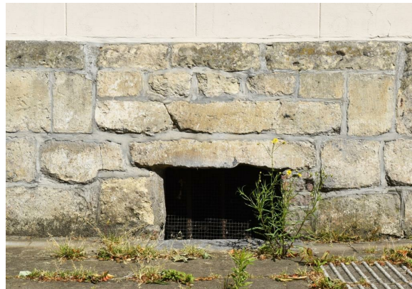
Rue Médori 2 et rue de Vrière 45, souterrain en façade latérale, 2017