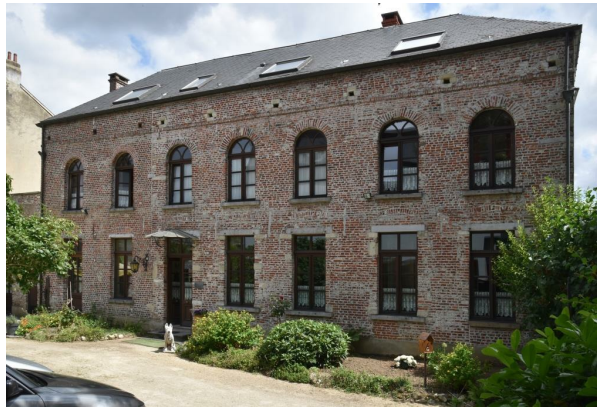
Rue Médori 2 et rue de Vrière 45, façade vers la cour, 2017