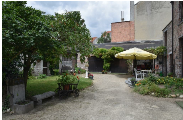
Rue Médori 2 et rue de Vrière 45, cour, 2017