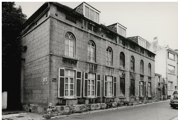
Rue Médori 2 et rue de Vrière 45, la façade à rue en 1982, AVB/FI C-23991