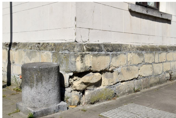
Rue Médori 2 et rue de Vrière 45, détail du soubassement, 2017

COSYN, A., «Les anciennes seigneuries de Laeken», Annales de la Société royale d'Archéologie de Bruxelles , t. 30, fasc. I, 1921, p. 54.