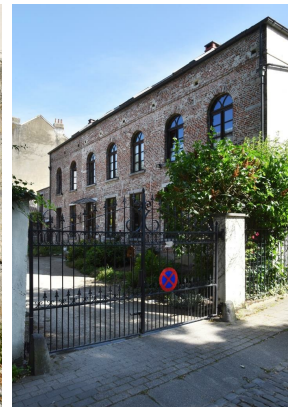
Rue Médori 2 et rue de Vrière 45, façade vers la cour, 2017