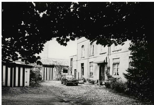
Rue Médori 2 et rue de Vrière 45, vue de la cour en 1982, AVB/FI C-23287