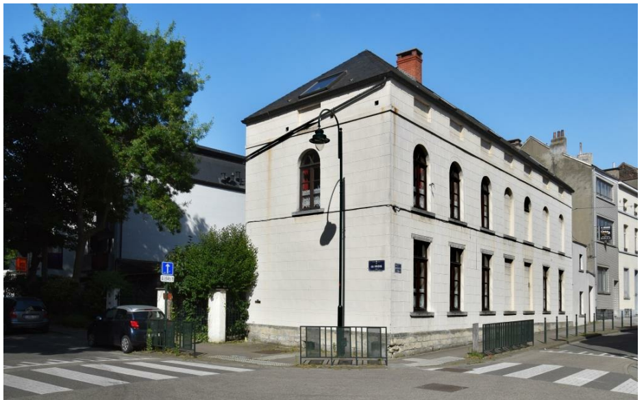
Rue Médori 2 et rue de Vrière 45, 2017

Région de Bruxelles-Capitale INVENTAIRE DU PATRIMOINE ARCHITECTURAL