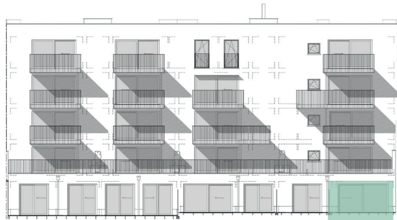
Westgevel / Façade Ouest