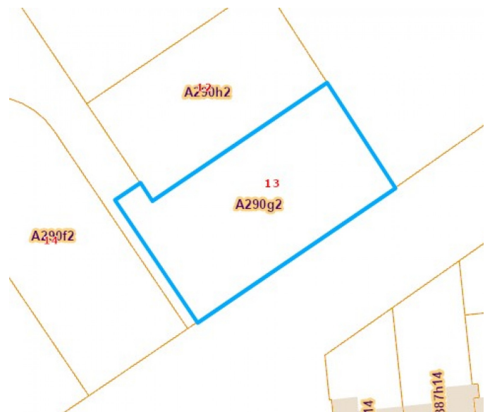
Informations provenant du site du cadastre