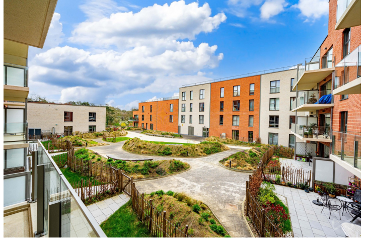
Le mobilier repris sur les photos ne fait pas partie de la vente conformément à l'article 3.9 du nouveau code civil.