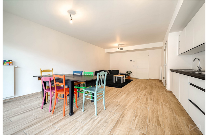
Le mobilier repris sur les photos ne fait pas partie de la vente conformément à l'article 3.9 du nouveau code civil.