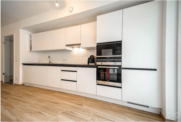
Le mobilier repris sur les photos ne fait pas partie de la vente conformément à l'article 3.9 du nouveau code civil.