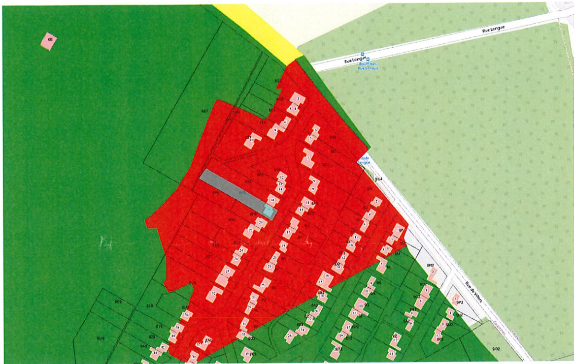
Schéma de structure 113