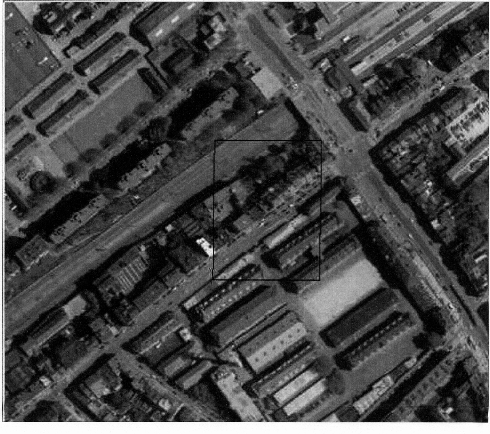
PLAN DE LOCALISATION - 1/2000 (cfr: BRUGIS)